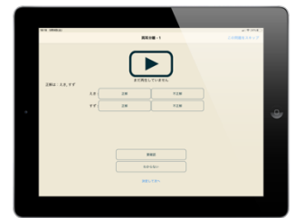
図 4 アプリケーションの画面

常の小学校でも実施が可能であることが確認された。小学校での実証実験は学校の協力を得て 24 名の児童のデータを取得することができた。しかし、学校での実施は時間的な制約が大きく、被験者と検査者が 1 対 1 で実施する本システムは一度に取れるデータ数が少ないという欠点がある。今回の小学校における実証実験には養護教諭（保健室の先生）の協力を得た。学校保健では定期検診の中で純音聴力検査を実施することから、本研究で開発したシステムを学校の中に導入するためには養護教諭等と連携し学校内での聞き取り困難ニーズを把握する仕組みを作ることが重要と考える。