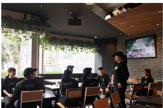
2018年3月にはハンバーガーショップSHAKE SHACKの協力で中学校3年生が職場体験もした。