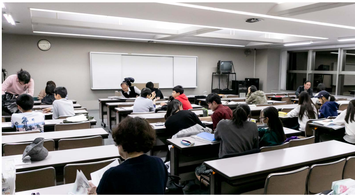
火・木・土曜の19時～21時に開かれている学習教室の中学生クラス。学生や主婦、会社員、退職者などがボランティアとして学習をサポートする。